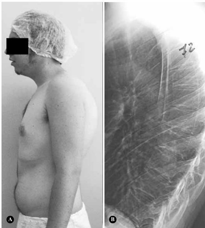
Figura 1 – A) Apresentação clínica; e B) Radiográfica da cifose de Scheuermann.

O objetivo deste estudo é comparar as características da amostra em questão, os resultados do tratamento quanto à melhora do quadro algico utilizando a EVA, o grau de correção da deformidade e a satisfação do paciente com o procedimento.